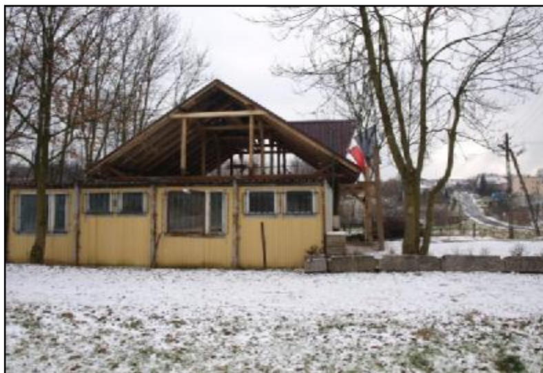
Budowa świątelnicy w Koźmicach Małych – stan prac na styczeń 2010